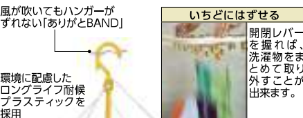
環境に配慮したロングライフ耐候プラスチックを採用

2,640円 (税抜2,400円) ●従来の洗濯ばさみと違って先端が開いており、洗濯物をつまんで固定。開閉レバーを握れば、洗濯物をまとめて取り外せます。 ●サイズ/幅36×奥行46×高さ39cm ●重量/725g ●材質/ポリプロピレン、ジュラコン、エラストマ、ステンレス鋼、シリコン、ナイロン、ポリエチレン ●色/ホワイト