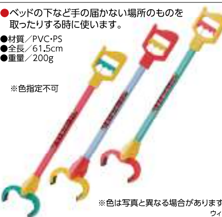
※色は写真と異なる場合があります。 ウィズ

1,650円 (税抜1,500円) ●ベッドの下など手の届かない場所のものを取ったりする時に使います。 ●材質/PVC・PS ●全長/61.5cm ●重量/200g ※色指定不可