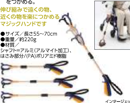
インタージェット

JBS111-13 11,330円 (税抜10,300円) ●先端部に厚めのラバー(シリコン入り)がついているので小さいものや薄いものがつかみやすい。 ●先端部は90°ずつ向きが変えられ、手をひねらずに物をつかめる。 伸び縮みで遠くのもの、近くのを楽につかめるマジックハンドです ●サイズ/長さ55~70cm ●重量/約220g ●材質/シャフト=アルミ(アルマイト加工)、はさみ部分/(PA)ポリアミド樹脂