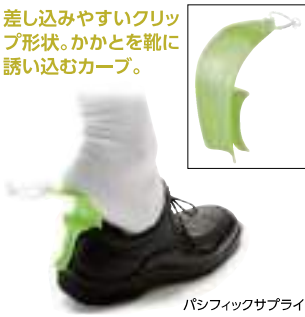
パシフィックサブライ

29415002 1,100円 (税抜1,000円) ●靴のかかとを挟み込むベラ自体が自立するため、靴べらを手で支える必要がありません。 ●サイズ/6×9.8×7cm ●材質/ポリカーボネート ●色/グリーン 差し込みやすいクリップ形状。かかとを靴に誘い込むカーブ。