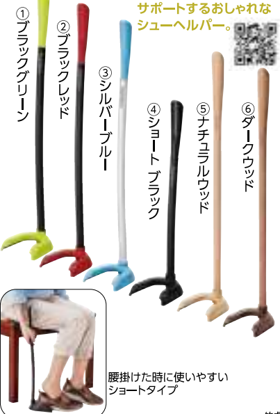
腰掛けた時に使いやすいショートタイプ