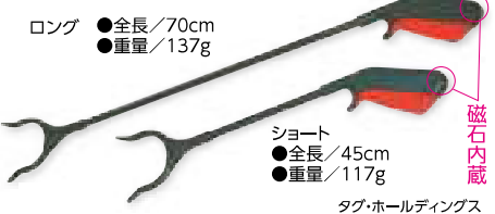
ロング ●全長/70cm ●重量/137g

ロング 4,070円 (税抜3,700円) ショート 3,850円 (税抜3,500円) ●手の届かない所でもラクラクキャッチ。 ●先端は硬めで、90度ごとに360度回転します。 落ちたもの、手の届かない場所のものもティッシュ1枚からつかむマジックハンド。 ハンドル部分に強力な磁石がついていますので、クリップやピンなどの鉄製小物なども簡単に拾うことができます。